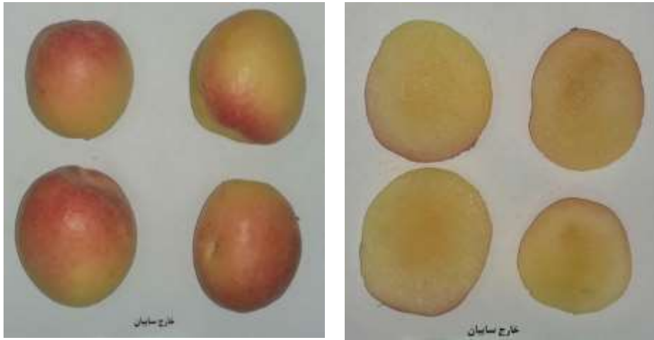
الف: میوه‌های شاهد در مرحله اول a: Control fruits in the first stage

۵۰ و ۳۰ درصد استفاده کرده بودند، مطابقت داشت (۳). در مرحله دوم تفاوت معنی‌داری بین فنول کل، pH و اسیدیته قابل تیتراژ در شاهد و تیمار مشاهده شد (جدول ۲).