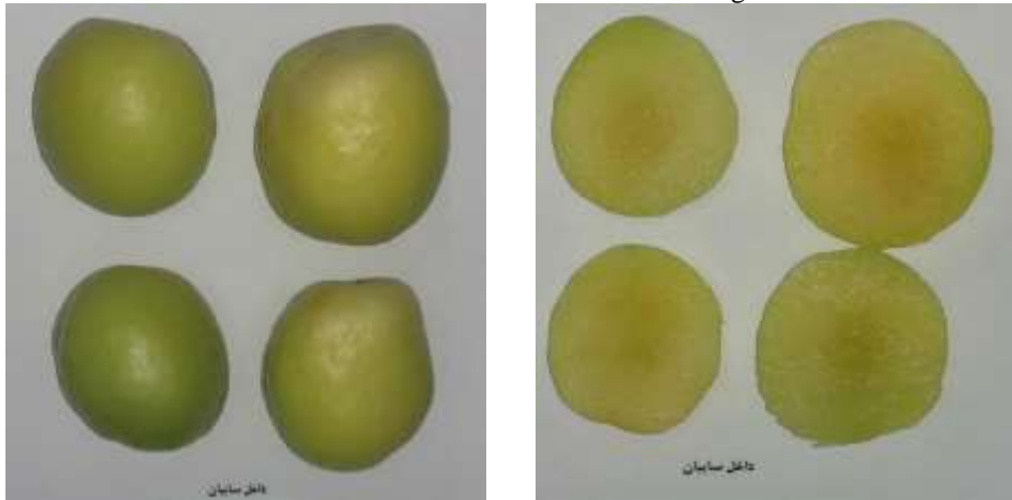
ب: میوه‌های داخل سایبان در مرحله اول b: Treatment fruits in the first stage