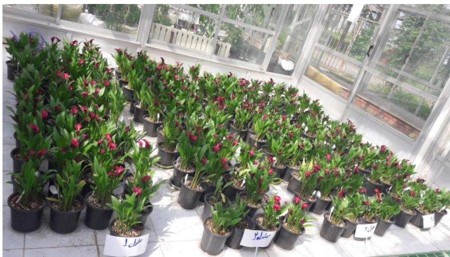
Fig. 1. Effect of nutrition solutions and vermicompost on growth and flowering of Calla lily ( Zantedeschia pentlandii cv. Allure) in soilless culture.

شکل ۱- تاثیر محلول های غذایی و ورمی کمپوست بر رشد و گلدهی گل شیپوری رقم آلور در کشت بدون خاک.