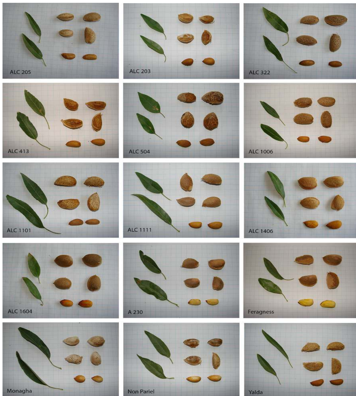
Fig. 3. Nut and kernel of 10 selected genotypes and five commercial cultivars of almond in northwest of Iran.

شبهات‌های زیاد در یک گروه با استفاده از تجزیه خوشه‌ای انجام شده است (۶، ۲۸). در یک مطالعه تنوع ۵۲ رقم بادام در جنوب ایتالیا از نظر ۲۰ ویژگی مربوط به درخت، خشک‌میوه و مغز مورد بررسی قرار گرفت. تجزیه خوشه‌ای این رقم‌ها، آن‌ها را در هفت گروه اصلی قرار داد که مهم‌ترین عامل در تشکیل خوشه‌ها درصد دوقلویی مغز و پس از آن ضخامت خشک‌میوه و مغز، شکل خشک‌میوه و مغز و نیز اندازه خشک‌میوه و مغز بودند. هم‌چنین درصد دوقلویی و درصد مغز ضریب تغییر بالایی را نشان دادند، اما میزان روغن مغز کمترین ضریب تغییر را در بین ویژگی‌های مورد ارزیابی نشان داد (۵).