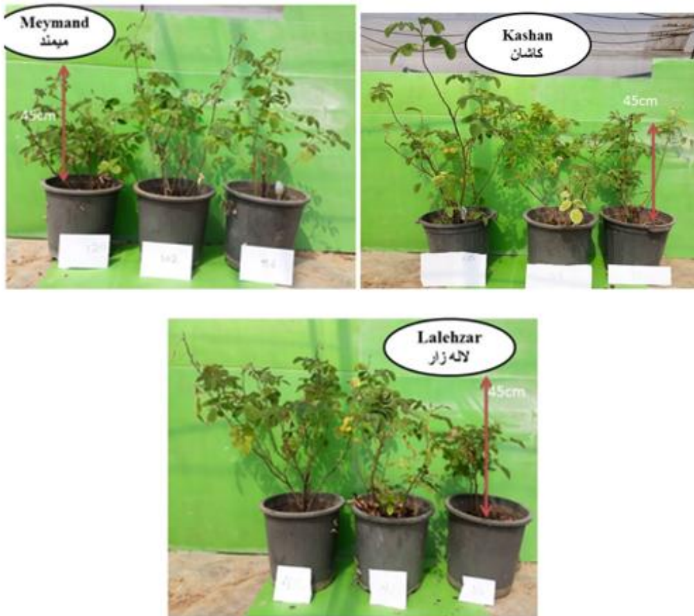
Fig. 1. Effect of salinity stress on the height of three damask rose populations (In all pictures from left to right the control treatment, salinity 3 and 6 \text{dS m}^{-1} ).

شکل ۱- اثر تنش شوری بر ارتفاع سه جمعیت گل محمدی (در همه عکس‌ها از چپ به راست تیمار شاهد، شوری ۳ و ۶ دسی‌زیمنس بر متر).