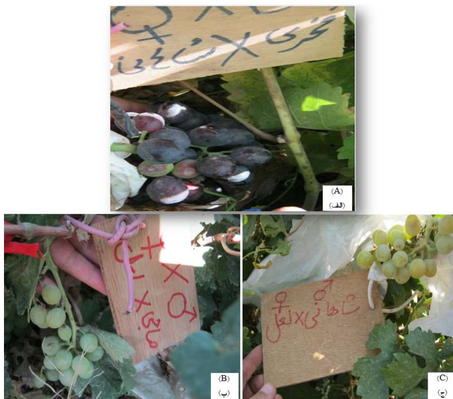
Fig. 2. The results of the crossing of grape cultivars: (A) Fakhri (♂) × Shahani (♀), (B) Shahani (♂) × Laal (♀) and (C) Sahebi (♂) × Laal (♀).

دانه‌گرده رقم فخری با والد مادری رقم شاهانی بود (جدول ۳ و شکل ۲ قسمت A، B و C). مطابق نتیجه‌های این تحقیق، در تلاقی دانه‌های گرده چهار رقم عسگری، ریش‌بابا سفید، بی‌دانه سفید و تبرزه سفید با والد مادری رقم قزل اوزوم ارومیه و همچنین در تلاقی دانه‌های گرده رقم‌های بیدانه قرمز، بیدانه سفید و پرلت با والد مادری رقم ریش‌بابا سفید، میزان تشکیل میوه در تلاقی‌های ذکر شده بیشتر از حالت خودگرده‌افشانی بود (۴، ۷). پژوهش‌ها نشان دادند که شمارش حبه‌های باقی‌مانده در شمارش‌های دوم و سوم برای تعیین اثر دانه‌گرده روی میزان ریزش حبه رقم والد مادری است. در مراحل بعدی اگر تنش‌های محیطی باعث ریزش میوه‌ها نشوند، عدم تکامل رویان یا رقابت میوه‌ها برای جذب عنصرهای غذایی عامل‌های اصلی ریزش حبه‌ها هستند (۲۳). ریزش گل و میوه در مراحل اولیه نمو یکی از مشکل‌های مهم انگور می‌باشد. عوامل متعددی می‌توانند ریزش گل و میوه انگور را زیر تأثیر قرار دهند. میزان و کیفیت آب، کیفیت خاک، هرس، کود، شرایط محیطی قبل و بعد گلدهی و همچنین گرده‌افشانی و لقاح موفق از جمله این عوامل می‌باشند (۲۰).