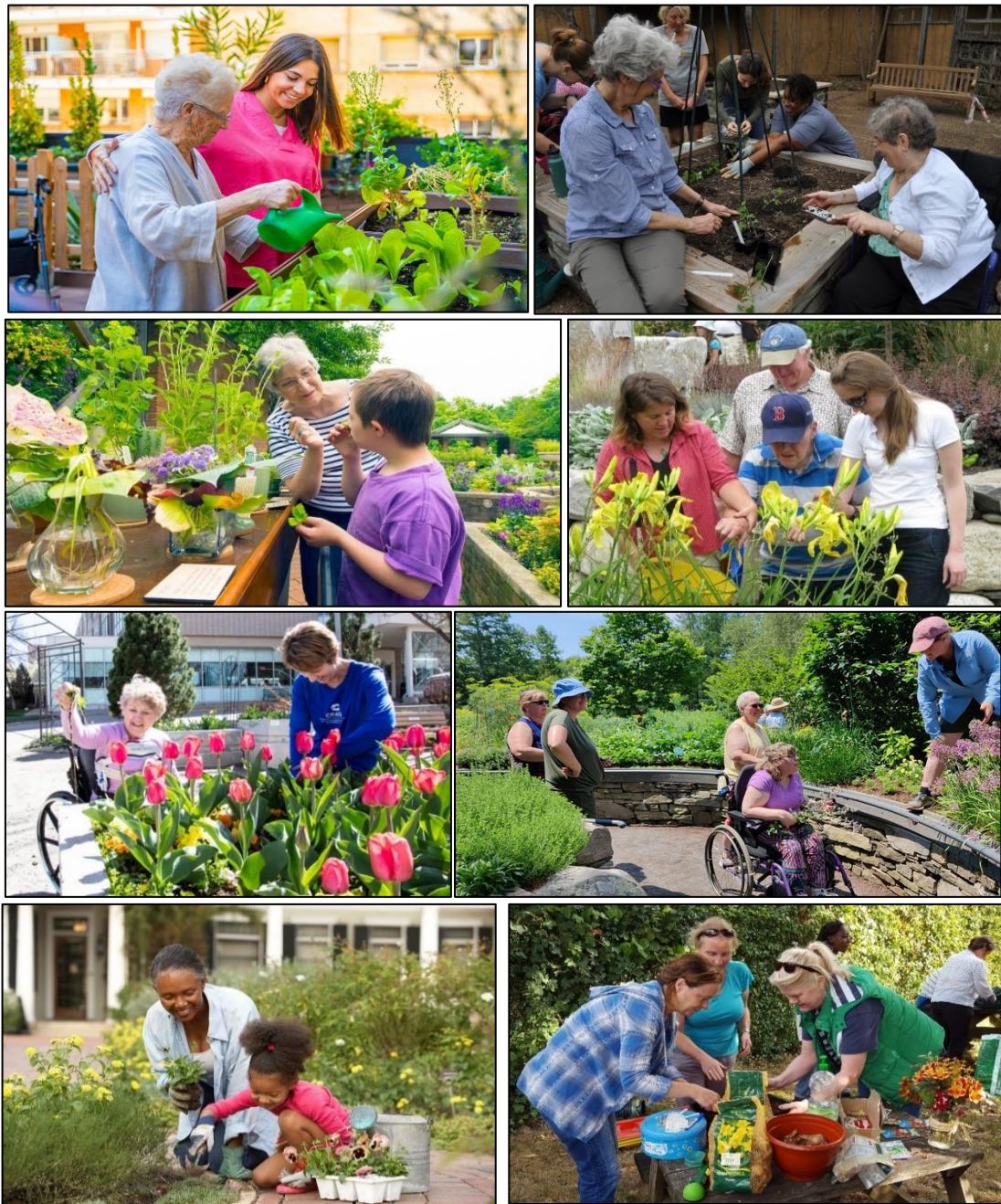
شکل ۲- تصاویری گوناگون از فعالیتهای باغبانی درمانی.

طولانی‌مدت، سازگاری‌هایی با طبیعت داشته‌اند و به همین دلیل طبیعت، اثر آرامش‌بخش روی انسان‌ها دارد (Altman & Patel., 2020; Scott et al., 2022; Lai et al., 2023).