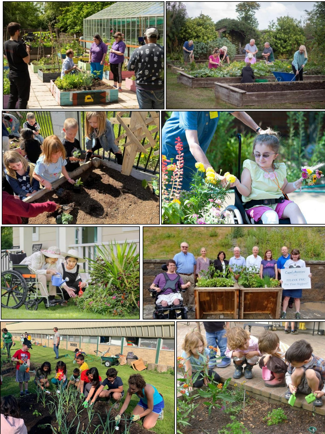
شکل ۳- تنوع فعالیت‌های باغبانی درمانی برای گروه‌های گوناگون جامعه.