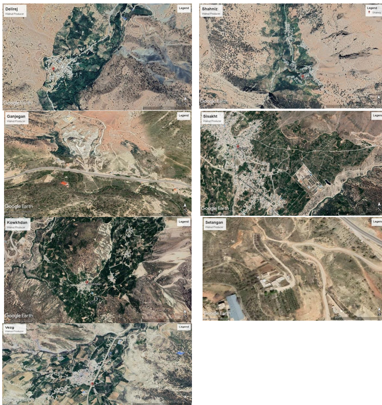
شکل ۲- تصاویر گوگل ارث مناطق گردو کاری استان کهگیلویه و بویراحمد.