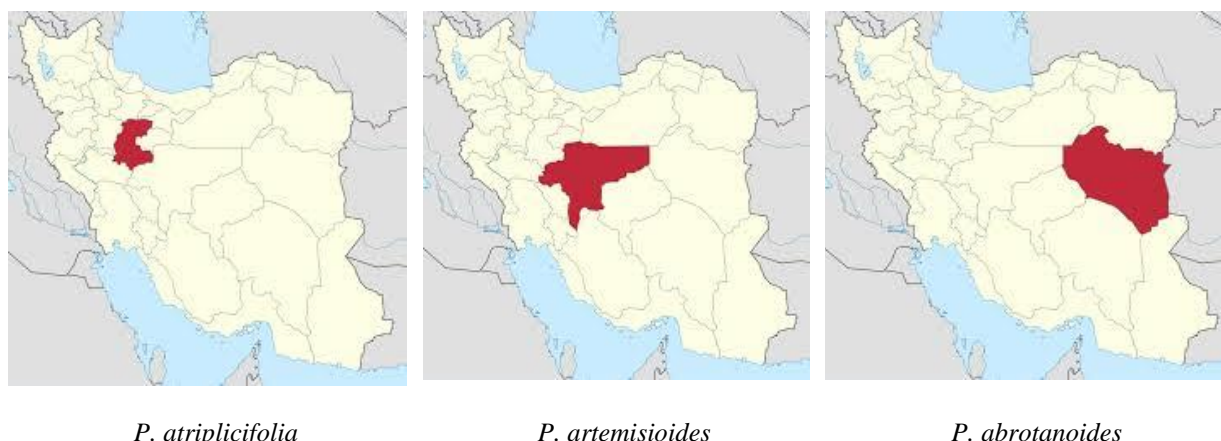
Fig. 1. Location of collecting Perovskia plants in Iran map.

شکل ۱- منطقه جمع‌آوری گیاهان برازمیل در نقشه ایران.