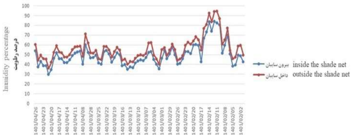
شکل ۴- نمودار درصد رطوبت در داخل (تیمار) و خارج (شاهد) سایبان.

رطوبت نسبی یکی فاکتورهای مهم محیطی دیگری است که در زیر پوشش سایبان بیشتر از شاهد است (شکل ۴). هر چقدر درصد سایه‌اندازی توری افزایش یابد، میزان رطوبت نسبی افزایش می‌یابد. تغییر رطوبت نسبی در بین توری‌های مختلف (از نظر سایه‌اندازی و رنگ) بسیار زیاد است. عوامل زیادی از جمله تغییر تابش، حرکت هوا در داخل و بیرون باغ، سرعت باد و همچنین تبخیر و تعرق روی آن تأثیرگذار است (Mahmoodi, 2021). با توجه به اینکه عوامل زیادی در میزان رطوبت در شاهد تأثیر گذار است اما به طور میانگین ۶ درصد تیمار افزایش رطوبت نسبت به شاهد داشت.