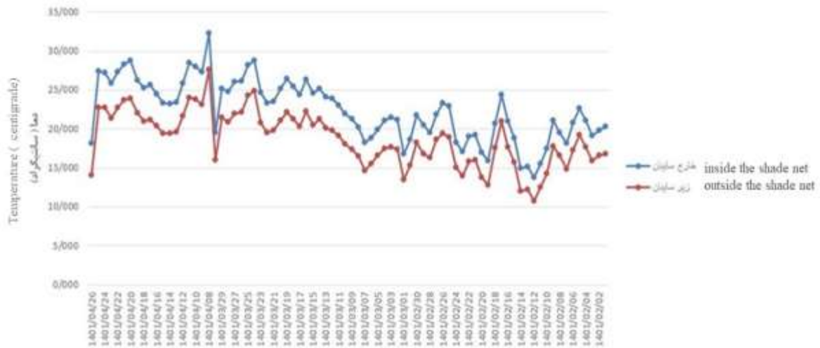
شکل ۳- نمودار دما در داخل (تیمار) و خارج (شاهد) سایبان.