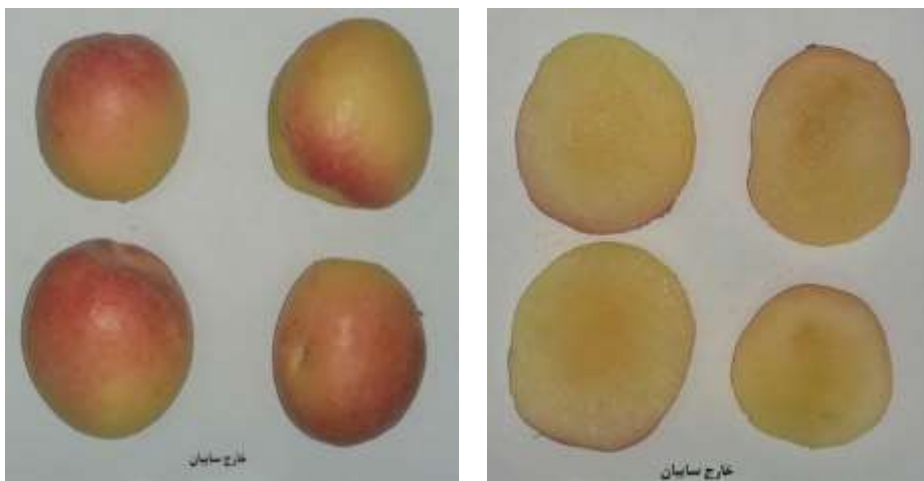
الف: میوه‌های شاهد در مرحله اول a: Control fruits in the first stage

۵۰ و ۳۰ درصد استفاده کرده بودند، مطابقت داشت (۳). در مرحله دوم تفاوت معنی‌داری بین فنول کل، pH و اسیدیته قابل تیتراژ در شاهد و تیمار مشاهده شد (جدول ۲).